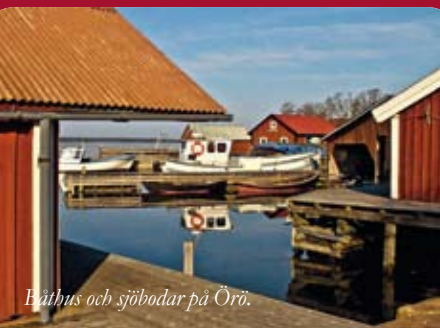
Båthus och sjöbodar på Öro.