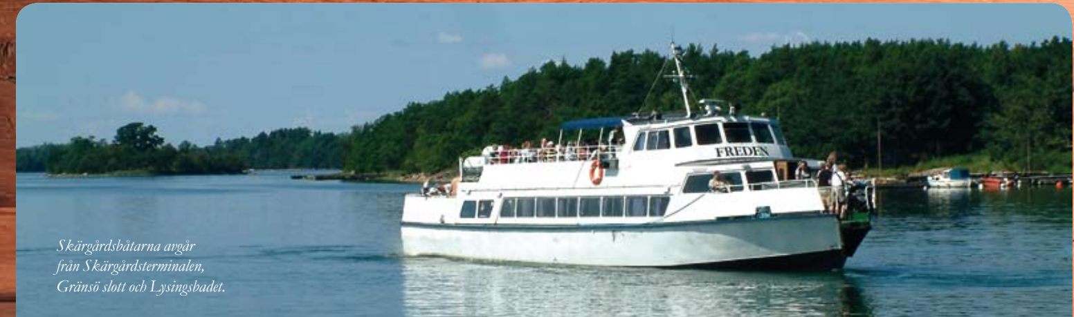
Skärgårdsbåtarna avgår från Skärgårdsterminalen, Gränsö slott och Lysingsbadet.

Gröna turer: Hasselö (tfn 070-467 63 52).